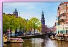
Paesi Bassi Province