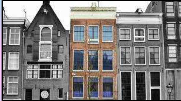
Domus Annae Frank