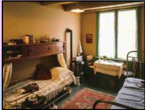
Cubile et tablinum Annae eius sororis