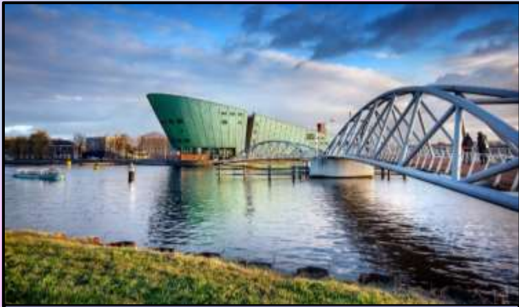
Museum "Nemo", forma navis, de technologia et omnibus scientiis