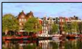
Haarlem, Noord- Holland.